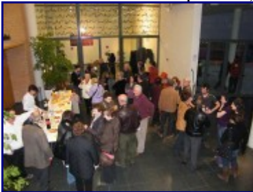
Públic assistent a l'acte